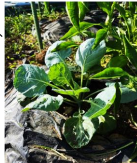
芽キャベツも順調→

9月23日(月・祝)25℃曇り 急に涼くなった三連休最終日の夕方。まだまだピーマンがたくさん採れる。そして、めっちゃ小さいいちごができていた！かわいい！4歳の娘に「食べる？」と聞くと「もうちょっと大きくなってからにする」というので、週末のお楽しみにしよう。